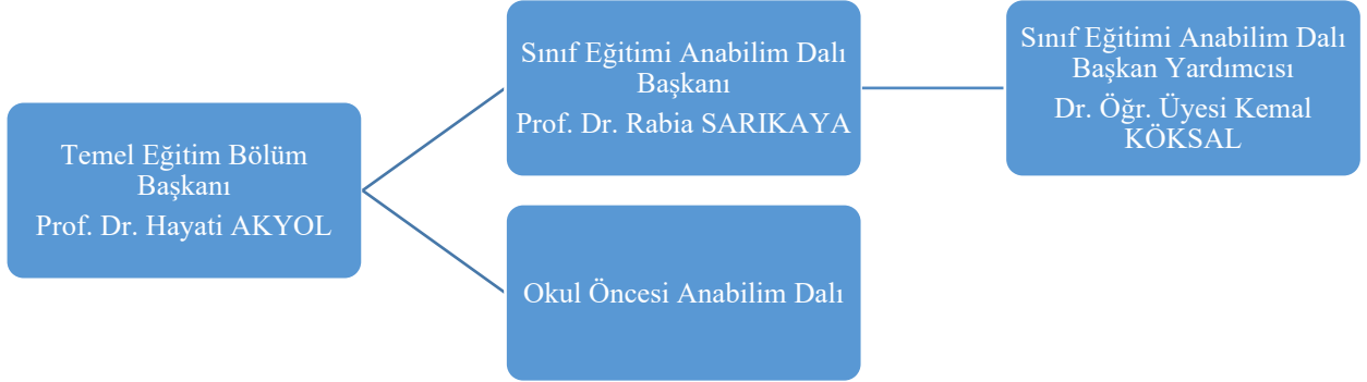
Şekil 1. Sınıf Eğitimi Anabilim Dalı organizasyon şeması

Sınıf Eğitimi Anabilim Dalı organizasyon şeması Şekil 1'de gösterildiği gibidir: